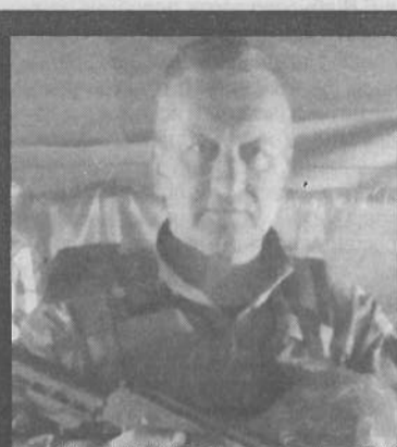
✓ Тарас Кубійович.