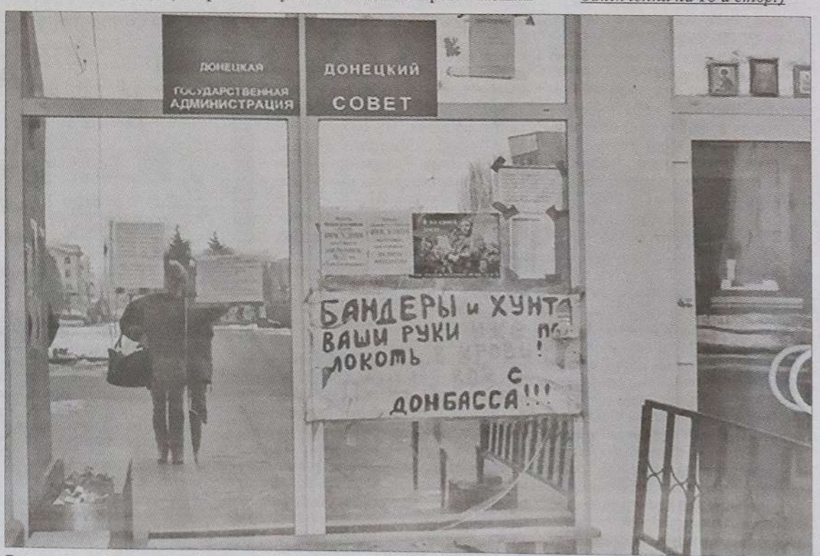
Плакат на вході до колишньої Донецької облдержадміністрації.