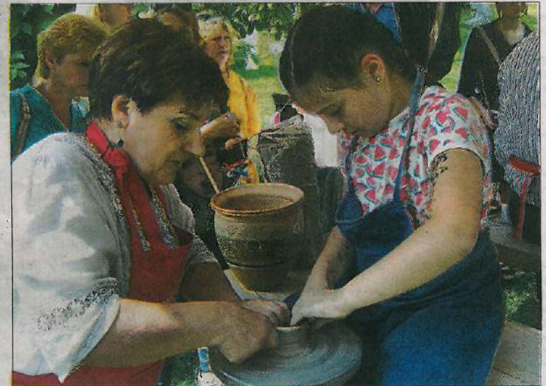
Гончарському роду нема переводу