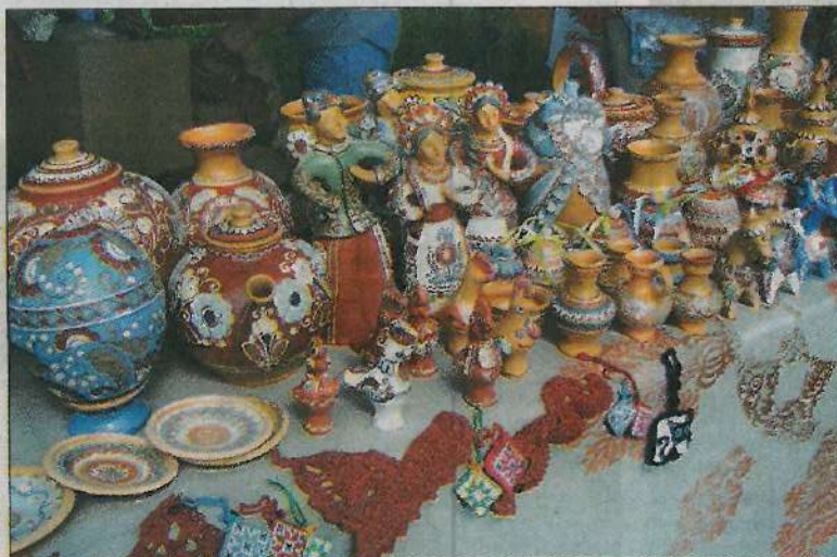
Кераміка майстрів навчально-виробничої майстерні Державної спеціалізованої художньої школи-інтернату I—III ступенів «Колегіум мистецтв у Опішному» імені Василя Кричевського

— Років 15 тому я написав статтю про занепад традиційних осередків українського гончарства, в якій намагався узагальнити світовий і український досвід з цього питання. Так ось, в усіх випадках, коли хтось намагався відродити завершений промисел, усе завершувалося невдачею. Нібито створювали якісь підприємства, невеликі заводики, творчі майстерні, проте із часом вони також занепадали. І зараз в Опішному хочуть створити гончарну артгіль, але є