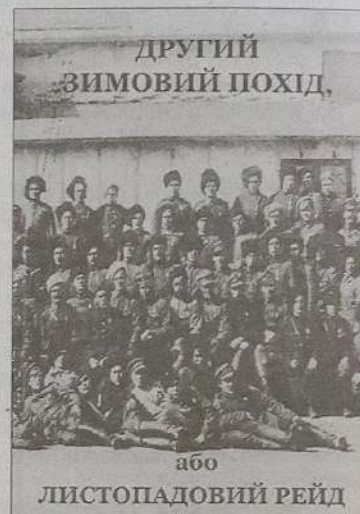
або ЛИСТОПАДОВИЙ РЕЙД