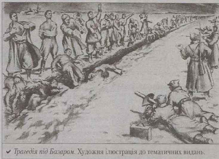
✓ Трагедія під Базаром. Художня ілюстрація до тематичних видань.