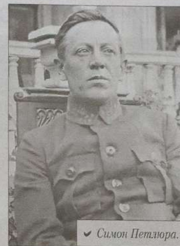
✓ Симон Петлюра.