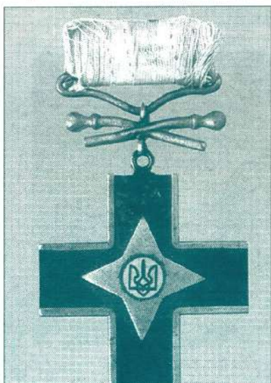
«Залізний хрест за зимовий похід і бої» – це єдина нагорода армії УНР.