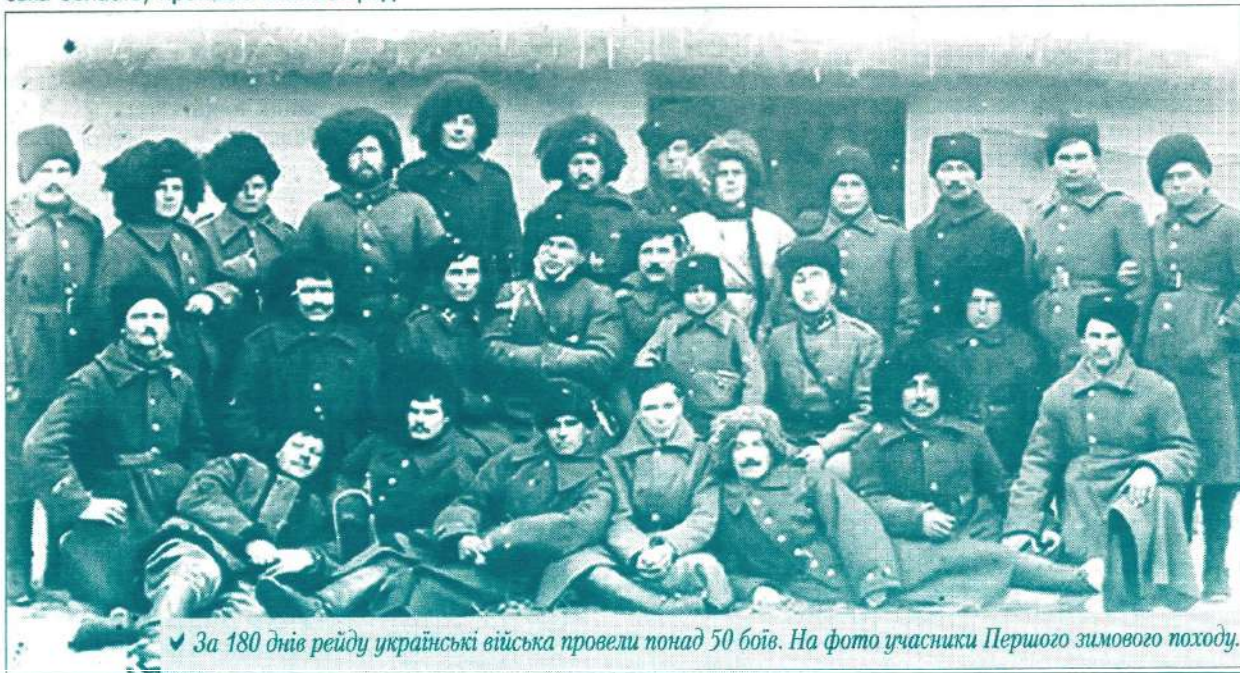
За 180 днів рейду українські війська провели понад 50 боїв. На фото учасники Першого зимового походу.

командування армією, керівництва УНР і представників політичних партій. До речі, Омелянович-Павленко в своїх мемуарах написав, що епідемія тифу завдала шкоди навіть командуванню: в нарадах не змогли брати участь троє полковників, у тому числі Омелянович-Павленко-молодший, – вони перебували в госпіталі. А головнокомандувач Василь Тютюнник і начальник його штабу були присутні з симптомами тифу.