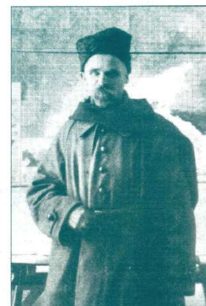
Ідею партизанського рейду тилами противника запропонував генерал-полковник Михайло Омелянович-Павленко. Він і очолював проведення цієї операції.

два корпуси генерал-лейтенантів Якова Слащова і Миколи Шилінга (їх загальна чисельність у різні періоди