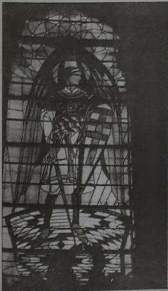
Вітражі церкви Успіння Пресвятої Богородиці у Львові.