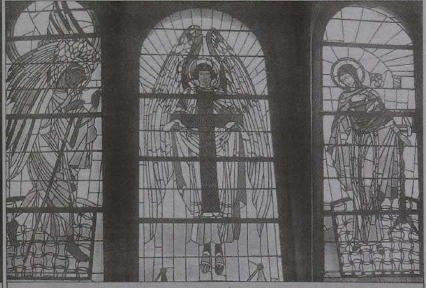
Вітражі церкви Успіння Пресвятої Богородиці у Мразинці (Борислав, Галичина).