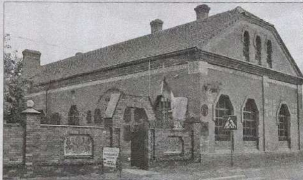
Такий вигляд має нині Будинок Кричевського — Лебіщак, в якому діє Музей мистецької родини Кричевських

Знаково, що захоплен- ня народним мистецтвом привело художника до гон- чарного містечка Опішного на Полтавщині. Упродовж 1902—1919 років він неодна- разово бував і жив тут, залу- чав майстрів до оздоблення