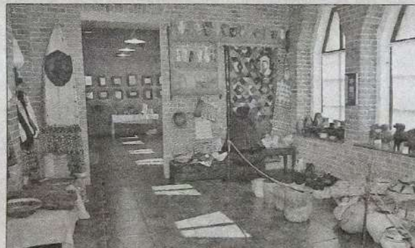
Фрагмент експозиції зали народного мистецтва

Адже Василь Кричев- ський — це не лише про ми- нуле. Це сучасник усіх май- бутніх поколінь. Його твор- чість про найголовніше — любов до Батьківщини, на- шу національну ідентичність, свідомість і непохитність сто- яти за рідну мову, мисте- цтво, традиції, право жити на своїй землі, творити задля неї й гідно нести у світ ба- гатовікову історію мужнього українського народу.