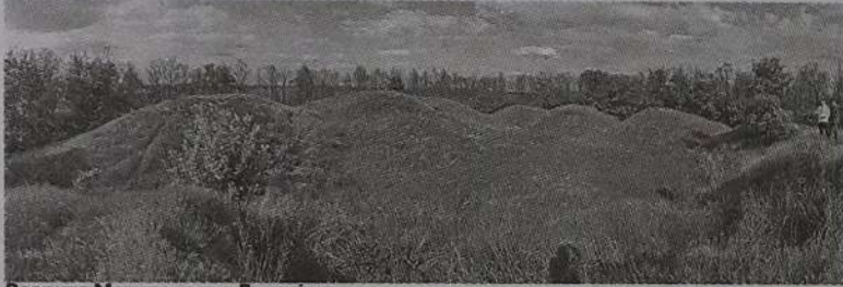
Розрита Могила, село Лихачівка.