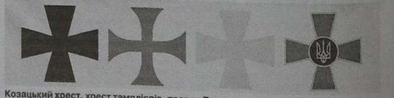
Козацький хрест, хрест тамплієрів, прапор Полтавщини, хрест ЗСУ.

До певного періоду частка козаків у Полтаві була незначна і всі визначали себе більше за родом діяльності, аніж етнічно. Основну частину людей склали місцеві русини з діда-прадіда або діти змішаних шлюбів із поляками, москowitzами, татарами.