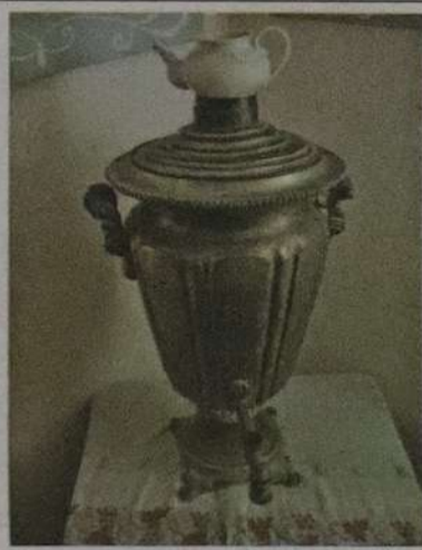
За допомогою самоварів у Березовій Рудці заварювали чай із місцевих трав.

Доля ще однієї дочки Гната — Марії Закревської-Бенкендорф-Будберг — гідна екранізації. Про неї складають легенди і приписують роботу відразу на три розвідки — СРСР, Британії та Німеччини. Марію Закревську прозвали «червоною Мата Харі». Вона двічі була заміжня за титулованими особами. Крім того, Марія Закревська працювала секретаркою Максима Горького і стала його коханою, провівши до смертного одра. А потім жила в любові з Гербертом Веллсом до самої смерті фантаста.