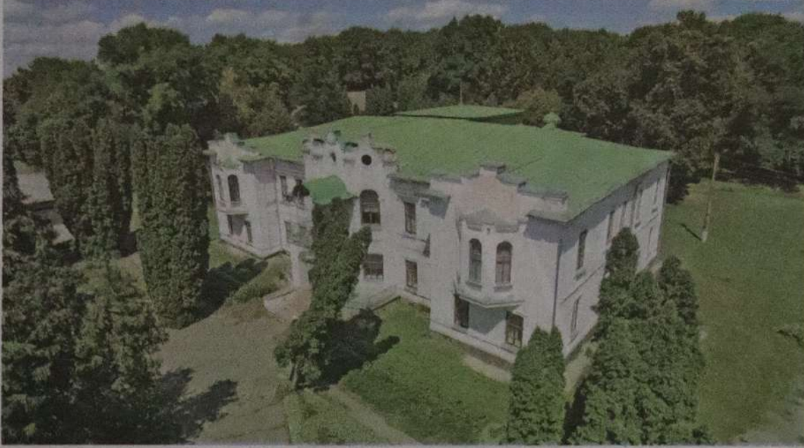
Після революції 1917 року палац Закревських «націоналізували» й перетворили на технікум.

Від Києва до Каїра — понад 3 600 кілометрів. А до села Березова Рудка — всього 150. У Березовій Рудці з Каїром є дещо спільне: в цьому невеличкому селі за 30 кілометрів від Пирятина і за 213 — від Полтави є піраміда. Одна з двох подібних українських пірамід-усипальниць, які були ще й каплицями.