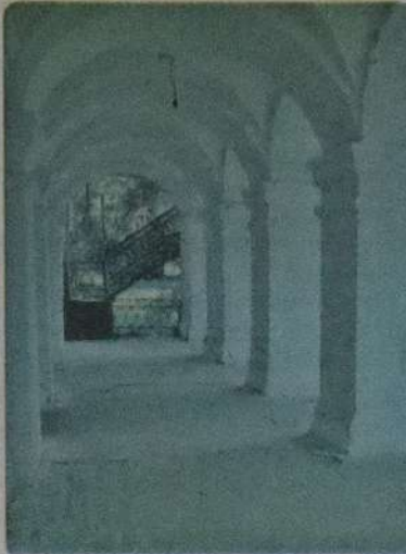
Тарас Шевченко часто згадував про Ганну Закревську на засланні. Присвятив їй кілька віршів.