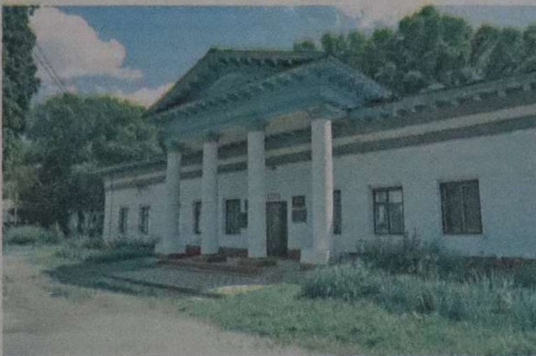
Гостьовий флігель, де зупинявся Тарас Шевченко, зроблений у стилі скромного класицизму.

У палаці проживали самі господарі. Піднімаючись сходами, якими ходив Тарас Шевченко,