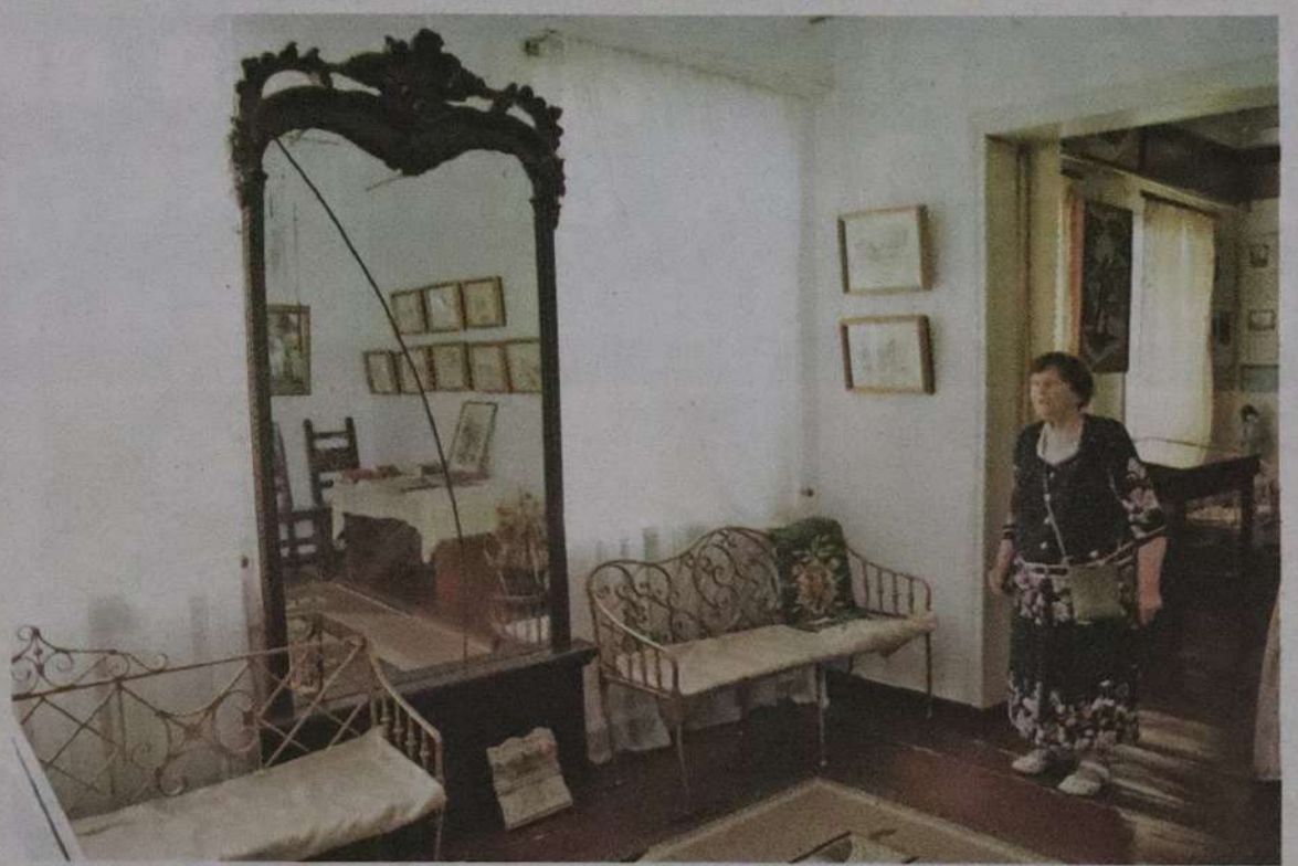
Експозицію історико-краєзнавчого музею розмістили у флігелі, в якому гостював Тарас Шевченко.

— Обер-прокурор першого департаменту правлячого сенату — так називалася його посада, — уточнює Валентина Гончар. — Його кар'єра дуже стрімко почалася і так само стрімко закінчилася. Він написав сміливу, дуже критичну статтю в англійську газету «The Times» щодо справи Дрейфуса. Усі прогресивні люди виступили на захист Дрейфуса. Гнат Платонович написав: «Як це так, що країна (Франція. — Авт.), яка називає себе передовою і найпрогресивнішою в Європі, допустила таку погрішність у своєму судочинстві?» І додав: «Можливо, через те, що вона подружилася з варварською Росією?» Після такого випадку Гнат Закревський потрапив у немилість царя.