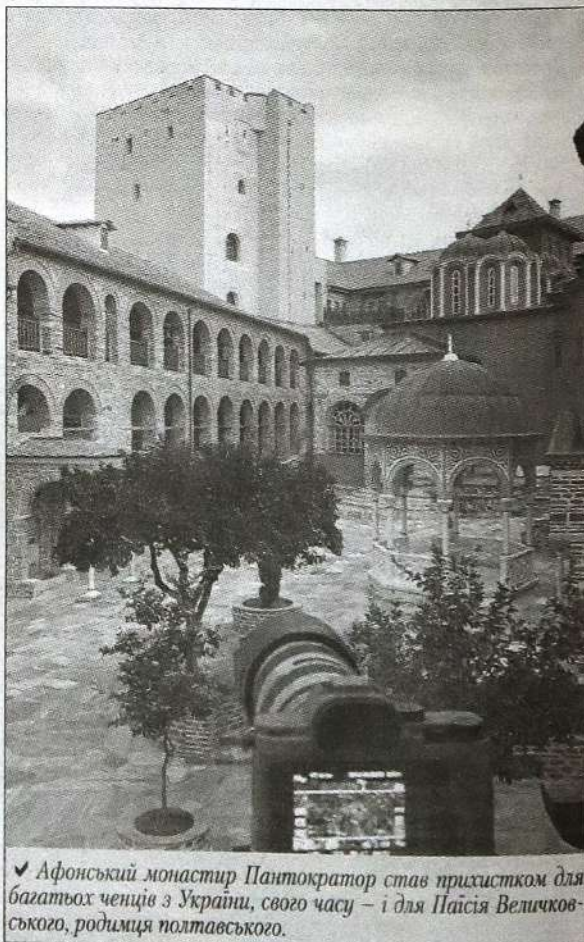
✓ Афонський монастир Пантократор став прихистком для багатьох ченців з України, свого часу – і для Паїсія Величковського, родимця полтавського.