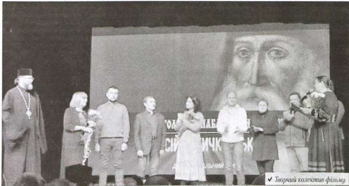
✓ Творчий колектив фільму.