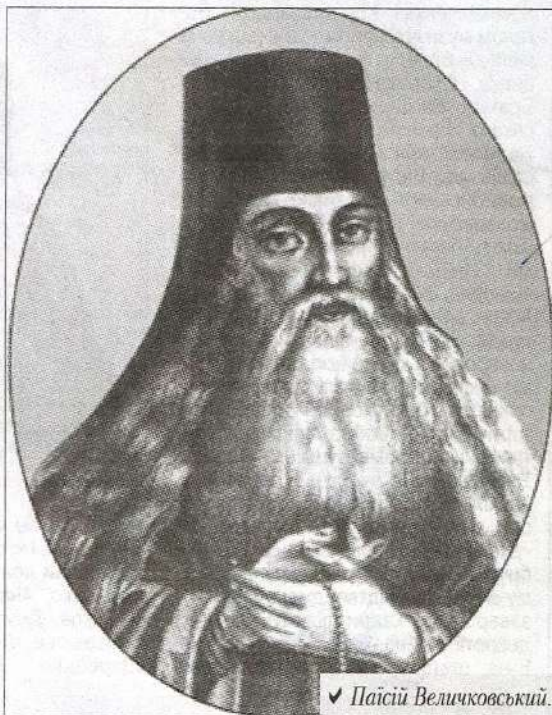
✓ Паїсії Величковський.

А в ніжні підліткові роки Петрусеві Величковському закладалося на дещо інший спадок – священицьку кафедру покійного батька у полтавському Свято-Успенському соборі. Поспілкувавшись із хрещеником, переконавшись у його не по літах освіченості, митрополит Київський і Га-