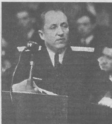
Роман Руденко виступає в залі засідань Нюрнберзького трибуналу.