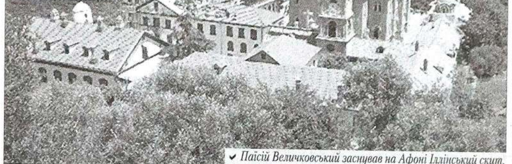
✓ Паїсій Величковський заснував на Афоні Іллінський скит.

ших днів дійшли лише факти, які він повідомляв у своїх листах (листувався з гетьманом Калнишевським, козацькою старшиною, діячами церкви). На схилі років Паїсій взявся за написання автобіографічної книги, але, на жаль, помер, не встигнувши розповісти в ній про роки, проведені на Святій горі. У листах Величковський розповідав про те, що, будучи ченцем, віддавався молитві й роздумам. Ченці на Афоні показали нам ікони, перед якими він молився, й книжку, яку читав, живучи в келії Костянтина й Олени.