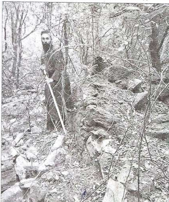
✓ Це все, що залишилося від келії, де жив преподобний Паїсій.

“Факти і коментарії”. Переклад з російської мови “Зорі Полтавщини”.