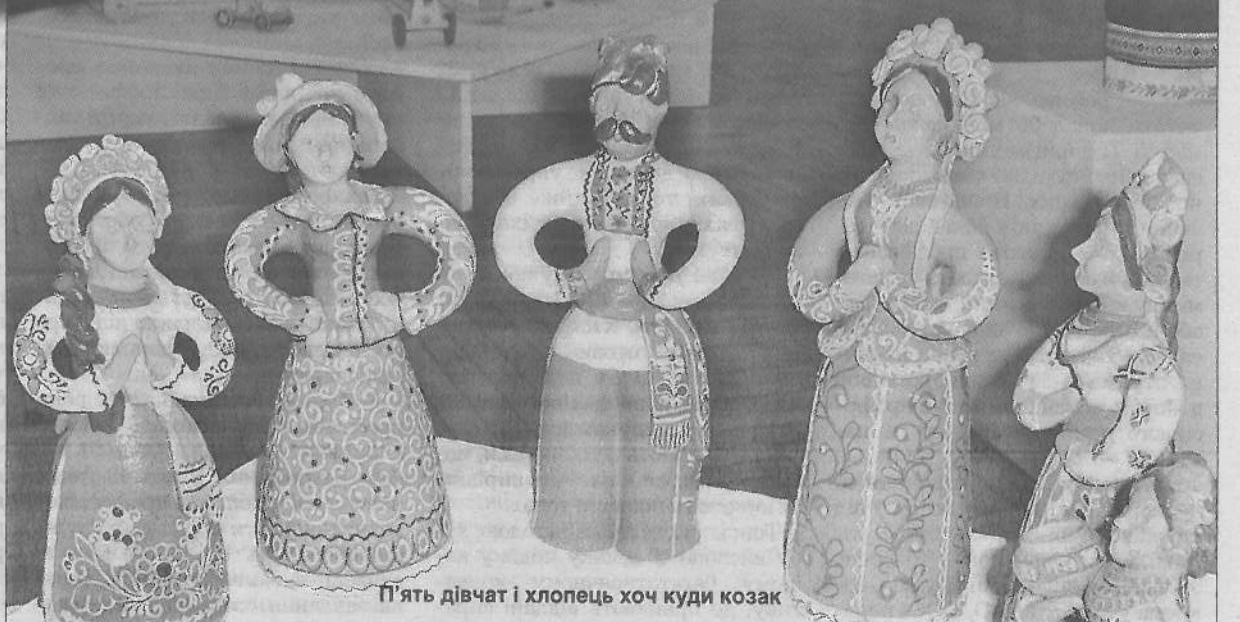
П'ять дівчат і хлопець хоч куди козак