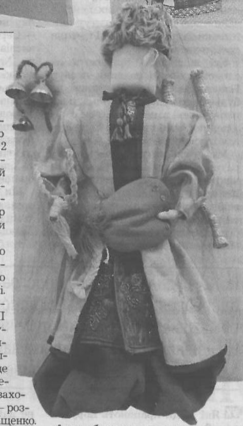
А парубок козу водить

Побувавши на заході, обов'язково підзарядитися світлою енергією на тривалий час. Виставка працюватиме до 8 лютого 2021 року. Вхід — без обмежень, вони стосуються тільки екскурсій.