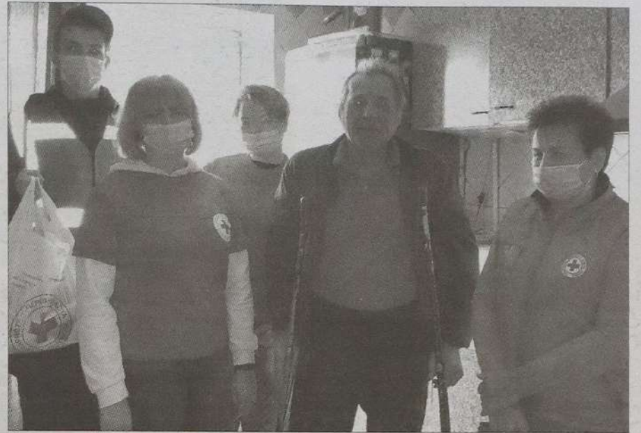
Волонтери Червоного Хреста завжди готові прийти на допомогу.

— Бувають такі ситуації, коли людина за віком чи станом здоров'я не може самостійно себе обслуговувати і потребує допомоги, а її діти або живуть в інших містах, або на заробітках, або в місцях позбавлення волі. І таке буває. Ми намагаємося нікого не залишити без підтримки. Наше соціальне обслуговування полягає в тому, що ми прибираємо у квартирі, готуємо їжу, оплачуємо у банківських відділеннях комунальні послуги за рахунками, допомагаємо підтримувати особисту гігієну. А загалом у нас працюють волонтери, які раніше були патронажними сестрами, тому жителі міста приходять до нас виміряти тиск, рівень цукру в крові. За потреби ми заварюємо для наших відвідувачів різні фіто-чай, які користуються чималим попитом у холодну пору року, особливо серед літніх людей.