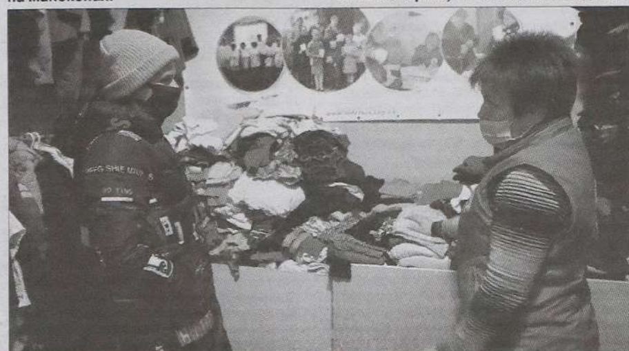
Ті, хто цього потребують, можуть підібрати у Банку речей будь-який одяг.