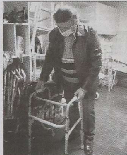
Узяти напрокат засіб реабілітації можна на такий термін, на скільки є необхідність.