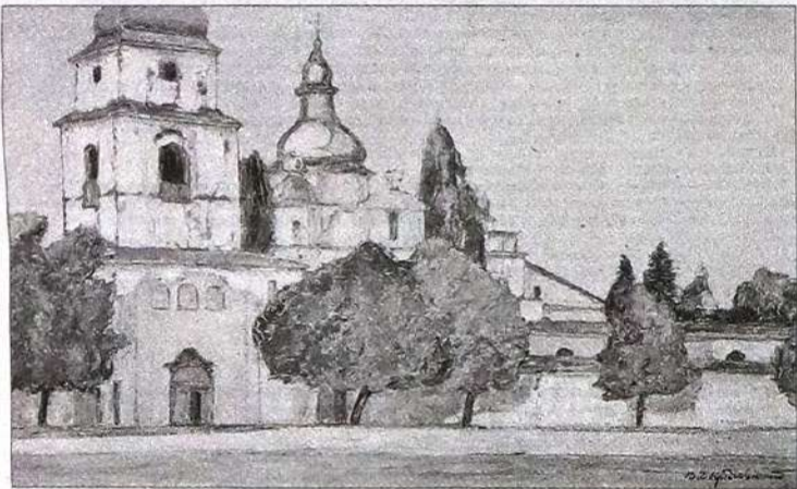
Михайлівський собор у Києві