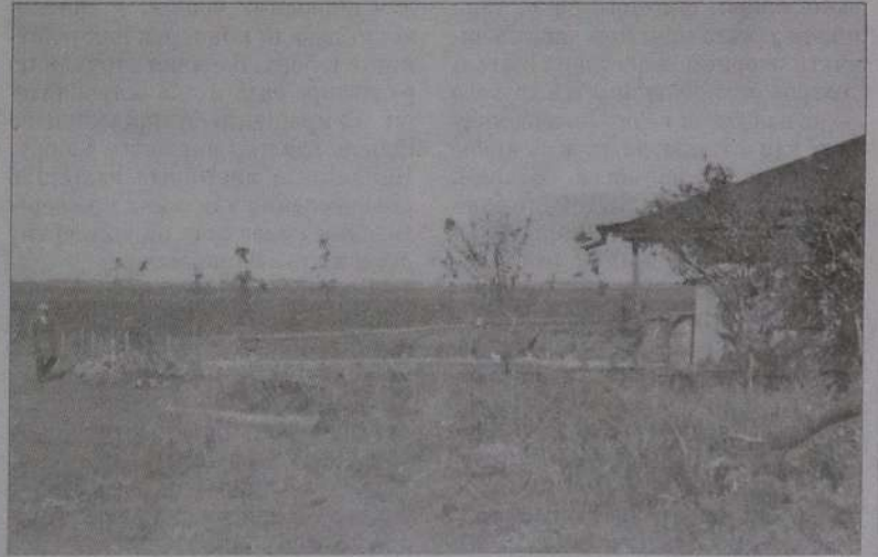
Околиці Кобеляк. Осінь 1941 року.