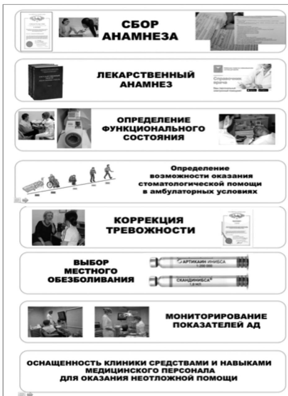
Рис. 3. Протокол проведения местного обезболивания.